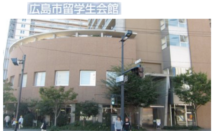
The usual meeting place (a 10-minute-walk from Hiroshima Station)

Hiroshima's Learner Development get-togethers continue to attract a reasonable number of people, and to serve various purposes, from among one small segment of the English teaching community in Hiroshima. We have a core of about fifteen people who join the get-togethers when they can, which generally works out that there are about eight of us at any one get-together. The majority are native English speaker university teachers, but we also have a couple of speakers of other languages, one learning advisor, one "lifestyle advisor" for exchange students, and one life-long independent language learner. We appreciate the variety we have, and are looking forward to more variety, to learning from beyond the comfort of our "teachers like us" environment. Join us!